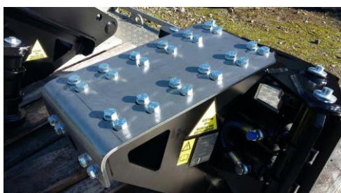
Optional "Leere", geschraubte Anbauplatte für die Aufschweissung vieler Schnellwechslertypen Komplette Platten mit LENHOFF MS 01, 03, 08