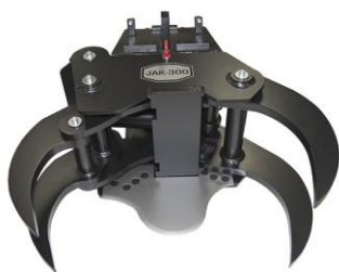
JAK 200, 250 und 300 für Anbau an Bagger