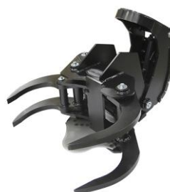
JAK 200 K und JAK 250 K für Anbau an Forstkrane