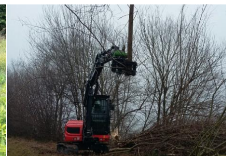
Robuste Bauart für das sichere Halten von Ast - und Baumwerk