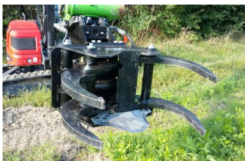
Schlanke robuste Arme für höchst mögliche Übersicht beim Schneideingriff