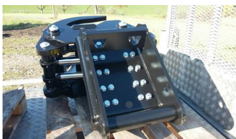
Konstruktion ausgelegt für höchste Arbeitsdrücke, Greifmechanik mit 2 Hydraulikzylindern