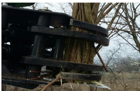
Gute Schneidleistung auch in zähen Haselstauden